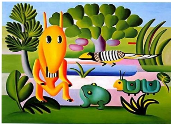
Cuca - 1924 Museus de Grenoble na França.

Outra influência das lendas em outras artes pode ser vista no quadro “A Cuca”, de Tarsila Amaral. Uma curiosidade sobre essa obra é que no começo de 1924, a artista escreveu a sua filha dizendo que estava fazendo uns quadros “bem brasileiros”, e o descreveu como “bicho inventado”.